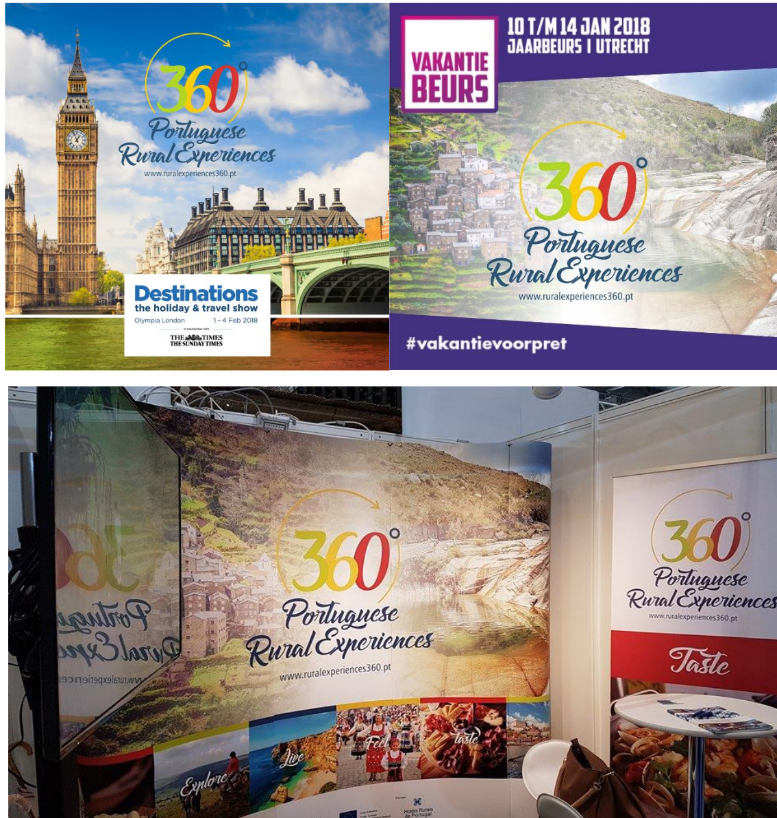
Imagens da 4ª fase de campanhas

Na quarta fase realizaram-se 3 campanhas para valorizar a presença na AHRP em Feiras Internacionais de Turismo: World Travel Market Londres de 2017, Vakantiebeurs e Destinations.