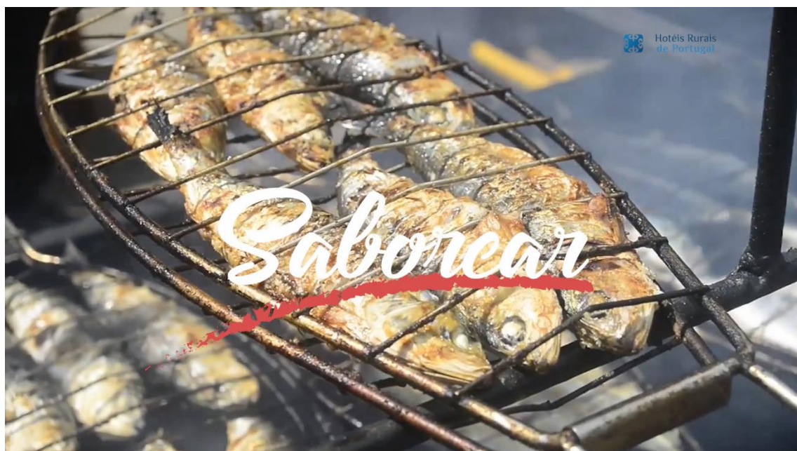
Imagens vídeos da 1ª fase de campanhas