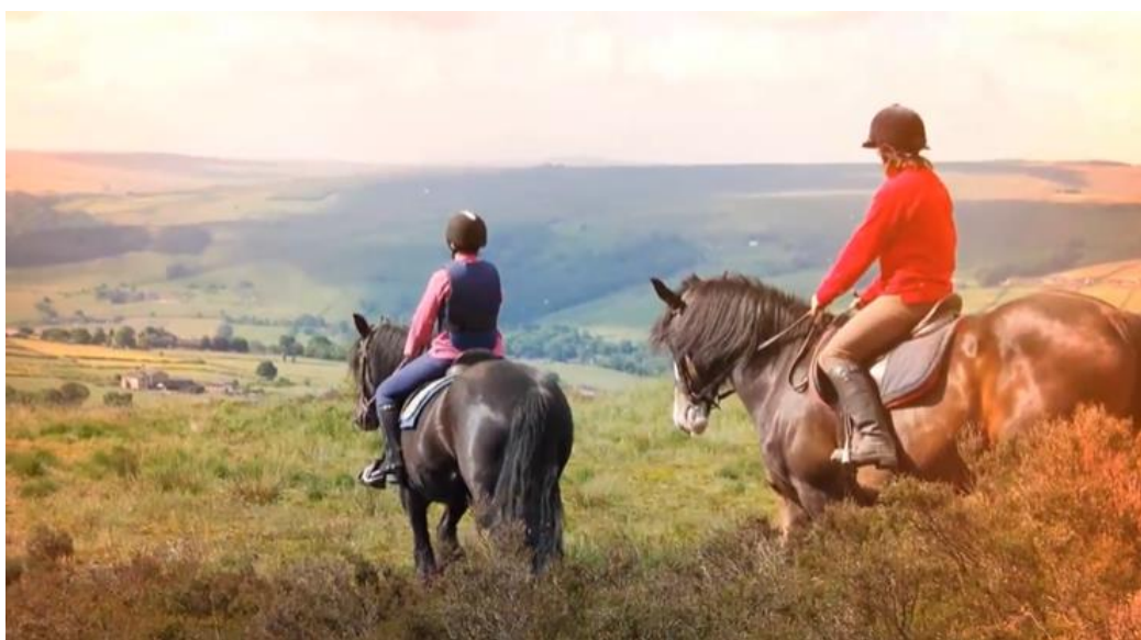
Imagens vídeos da 1ª fase de campanhas

A primeira fase divulgou um vídeo de apresentação do projeto através de 7 campanhas para 7 países diferentes (Alemanha, Bélgica, Brasil, França, Holanda, Reino Unido e Suécia). Apostou-se num público-alvo com idade compreendida entre os 35 e os 65 anos e que possuíssem 10 interesses relacionados com o projeto.