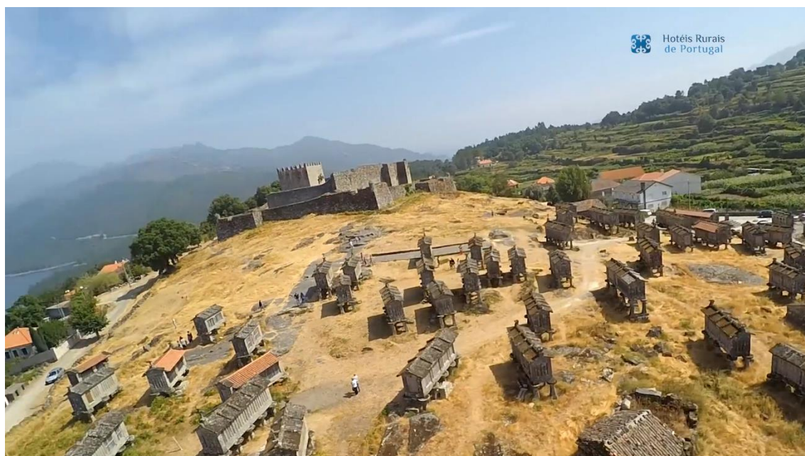
Imagens vídeos da 1ª fase de campanhas