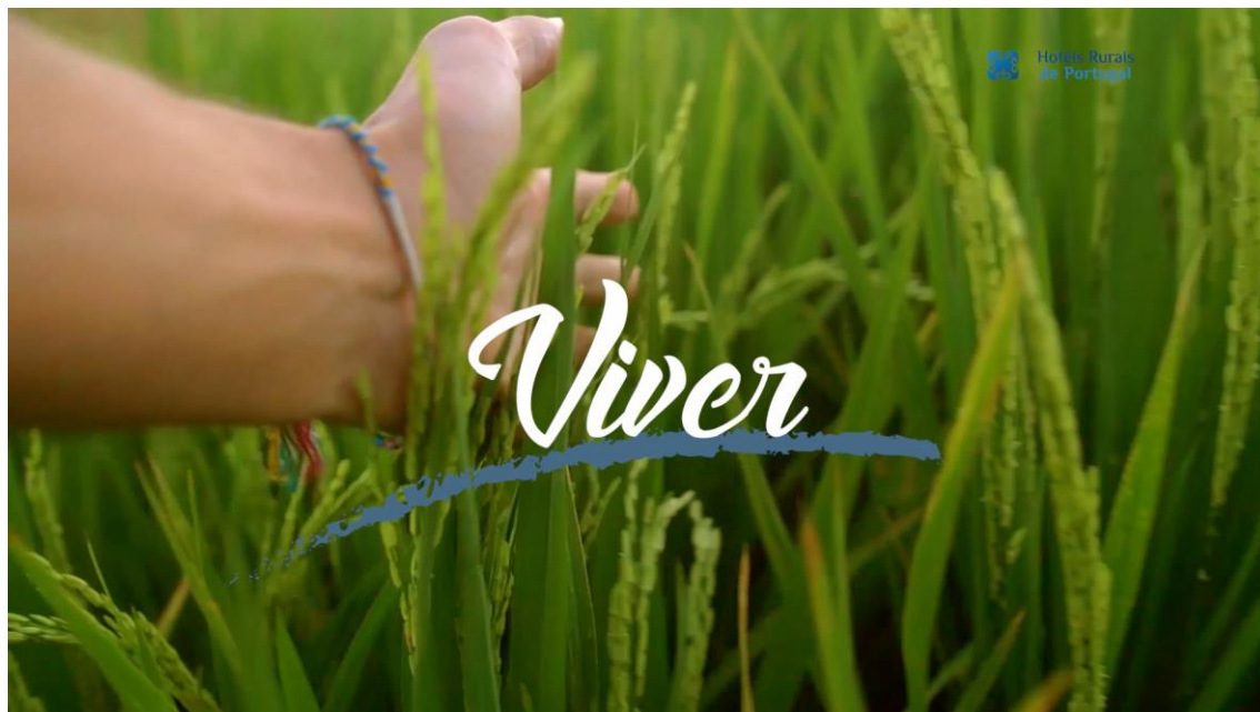
Imagens vídeos da 1ª fase de campanhas