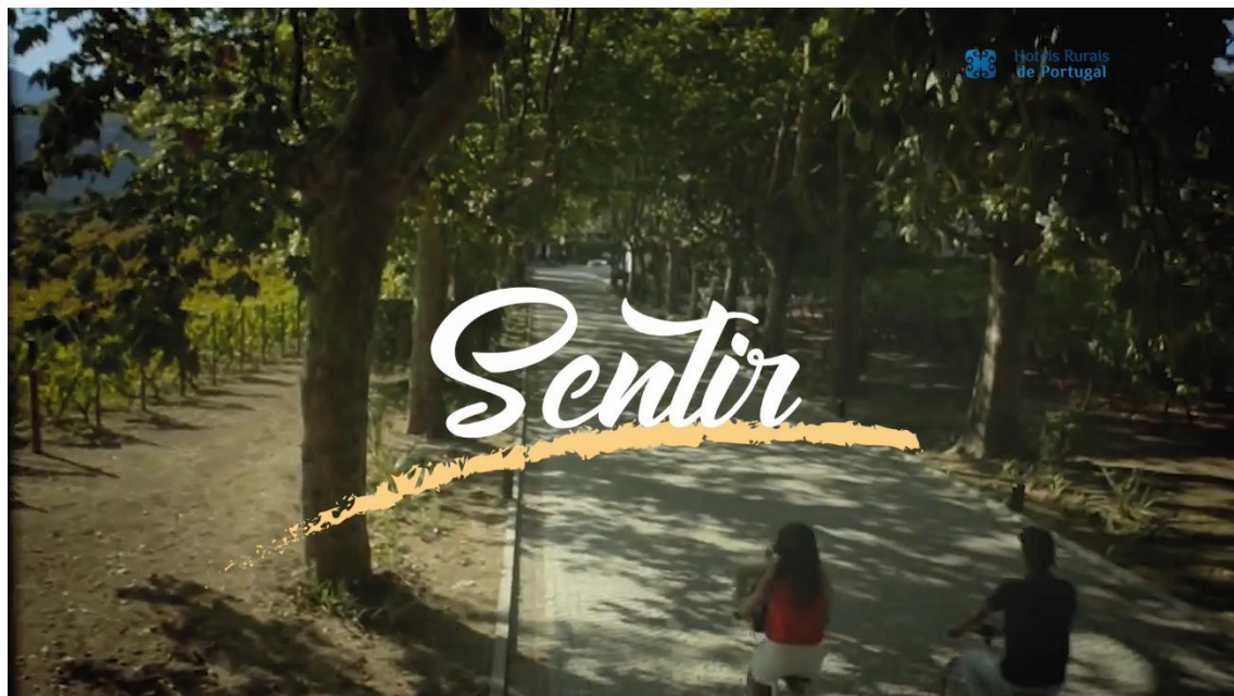
Imagens vídeos da 1ª fase de campanhas