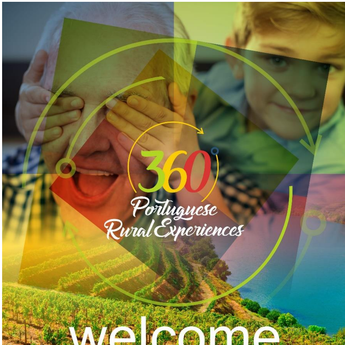
Imagens da 3ª fase de campanhas

Na terceira fase utilizou-se uma imagem intergeracional para lançar o desafio para explorar Portugal durante todos os dias do ano, através dos Hotéis Rurais. Realizaram-se 7 campanhas para 7 países diferentes (Alemanha, Bélgica, Brasil, França, Holanda, Reino Unido e Suécia). Assim como as campanhas anteriores, voltou-se a apostar num público-alvo com idade compreendida entre os 35 e os 65 anos e que possuíssem 10 interesses relacionados com o projeto.