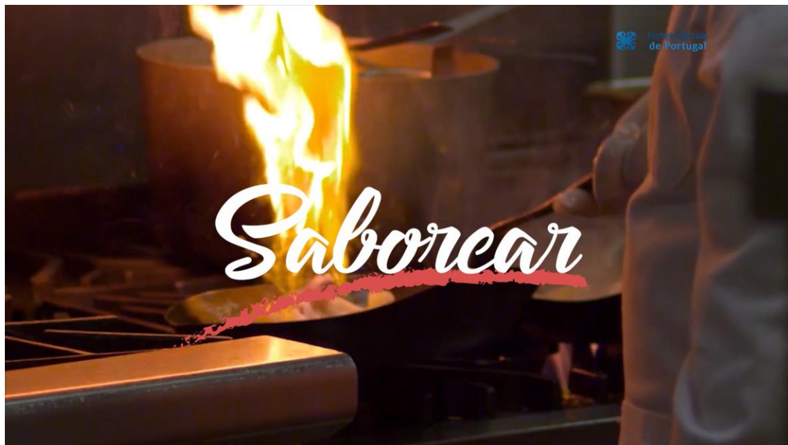
Imagens vídeos da 1ª fase de campanhas