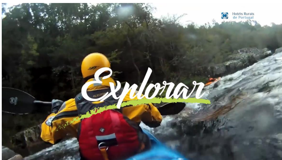
Imagens vídeos da 1ª fase de campanhas