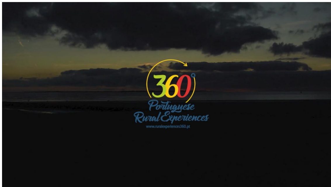
Imagens vídeos da 1ª fase de campanhas