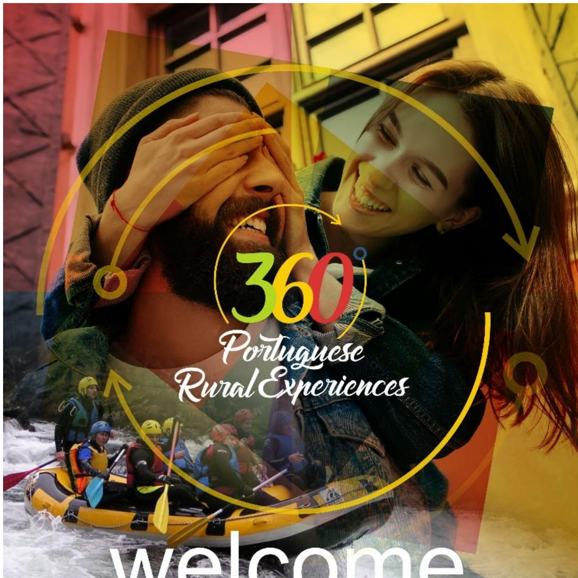
Imagem da 2ª fase de campanhas

Na segunda fase recorreu-se a uma imagem com o apelo ao imaginário de quem procura uma experiência rural autêntica. Realizaram-se 7 campanhas para 7 países diferentes (Alemanha, Bélgica, Brasil, França, Holanda, Reino Unido e Suécia). No seguimento da campanha anterior, voltou-se a apostar num público-alvo com idade compreendida entre os 35 e os 65 anos e que possuísem 9/10 interesses relacionados com o projeto.