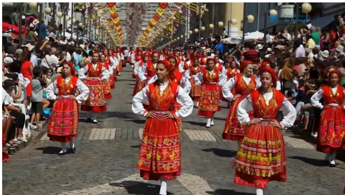
Imagens vídeos da 1ª fase de campanhas