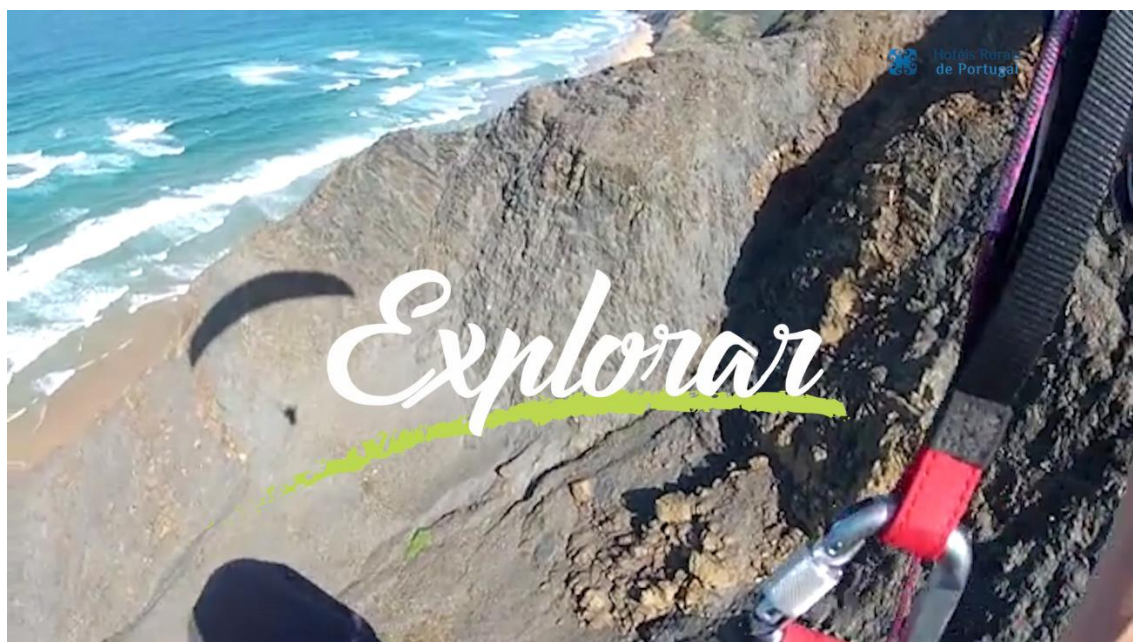
Imagens vídeos da 1ª fase de campanhas