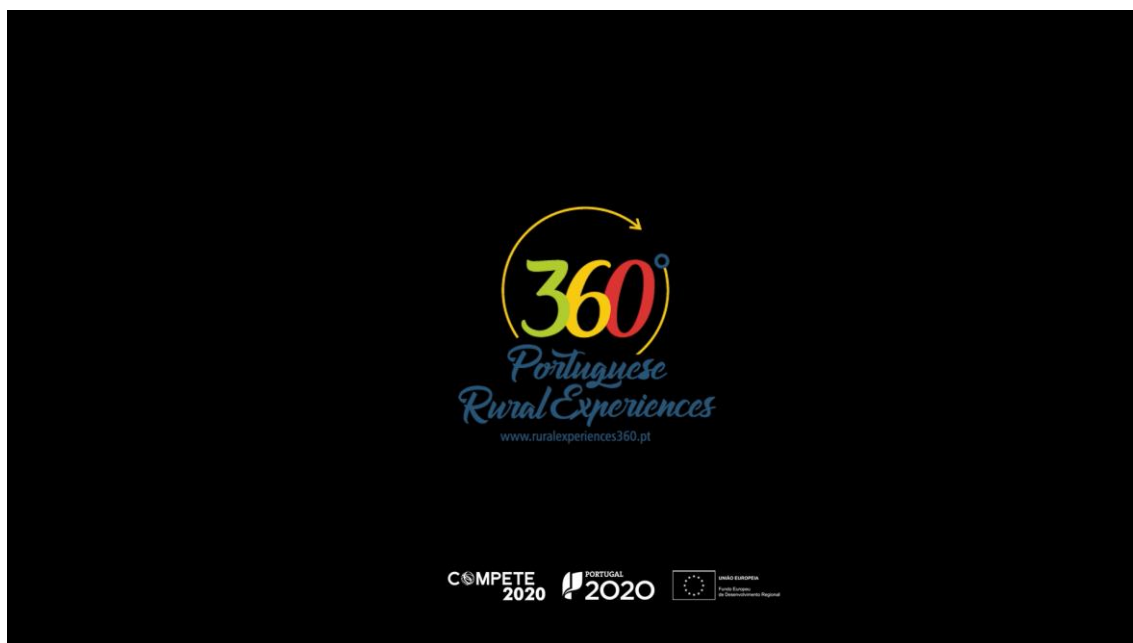
Imagens vídeos da 1ª fase de campanhas